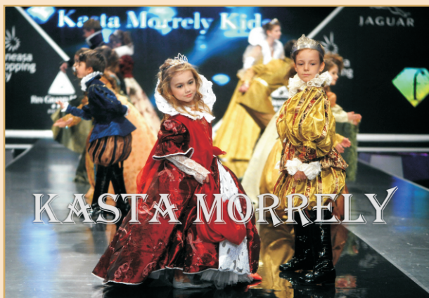
Teatrul de Modă Kasta Morrely Kids „Royal Children”