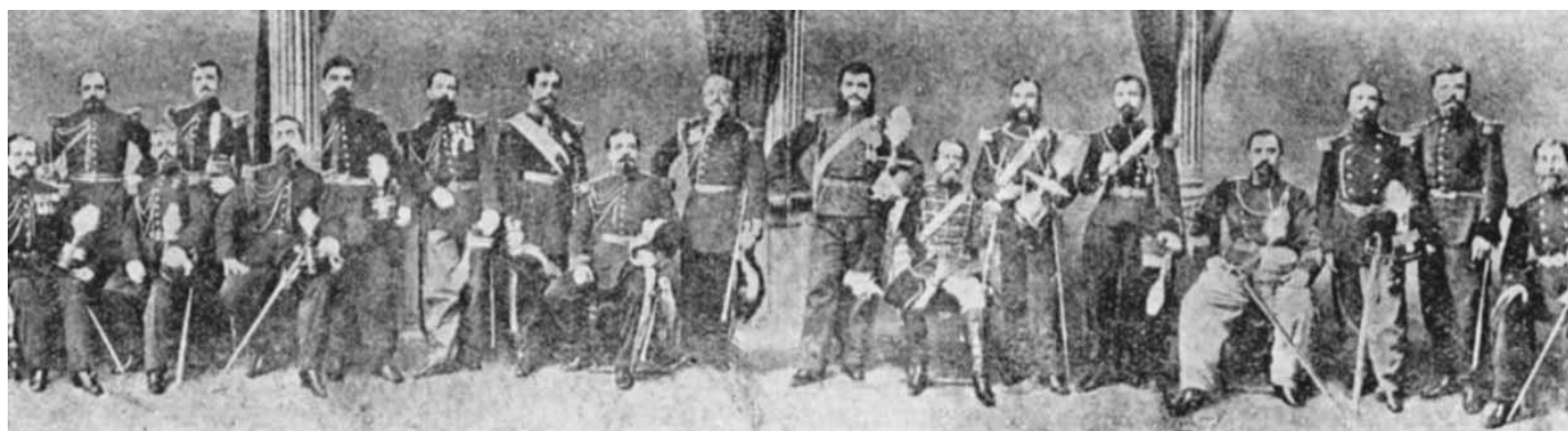
Comandanții principalelor structuri militare din timpul lui Cuza Vodă (1862)